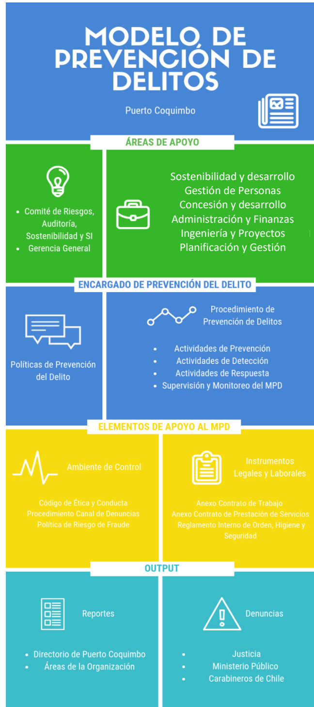
Figura 1: Estructura Organizacional MPD, Puerto Coquimbo.